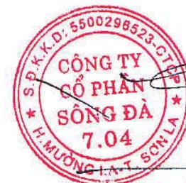
Ngô Quốc Thế